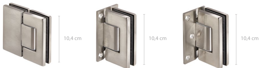
Zawias regulowany sprężynowy (szkło - szkło), 180° TGAH902

W skład serii RIMINI wchodzi 3 zawiasy sprężynowe, które będą odpowiednie do montażu drzwi ze szkła, którego grubość to 10 lub 12 mm. Szerokość tafla je wypełniającej może wynosić nawet 900 mm, a ciężar do 65 kg.