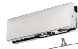
Zawias dolny PD12 z łożyskiem