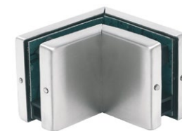
Łącznik dwóch paneli szklanych pod kątem 90° PD70-90