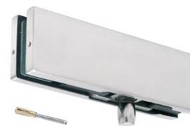
Łącznik naświetle – ściana PD30

Zawiasy z serii Como lub Calabria, nazywane również zawiasami typu strop-podłoga, umieszczają się na dolnej oraz górnej krawędzi szkła. Pozwala to na ich otwarcie pod dowolnym kątem zarówno do środka, jak i do zewnątrz pomieszczenia. Dostępnych jest kilka wariantów zawiasów górnych oraz dolnych, w tym z przesuniętą osią (tzw. zawiasy offset) oraz wbudowanym łożyskiem, co dodatkowo ułatwia ich montaż.