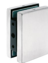
Łącznik panelu ze ścianą PD85