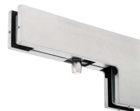
Łącznik naświetla górnego z bocznym PD40

Łączniki typu szkło - ściana umożliwiają przymocowanie szklanego panelu bezpośrednio do murowanej powierzchni. Dostępne są w dwóch wariantach: standardowym oraz, podobnie jak zawiasy, z przesuniętą osią lub łożyskiem. Ułatwia to instalację szklanych tafli w sytuacji, gdy brakuje miejsca na swobodny montaż okucia.