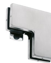
Łącznik naświetla górnego z panelem bocznym i stoperem PD63S