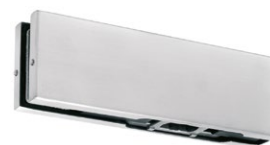
Zawias dolny PD10

Seria COMO oraz CALABRIA to kolekcje łączników naświetli, klamer oraz zawiasów, które umożliwią montaż różnorodnych konstrukcji szklanych, wykonanych ze szkła o grubości 10 lub 12 mm. Warto także zaznaczyć, że w przypadku zawiasów szerokość drzwi może wynosić aż 1000 mm, a ciężar nawet do 90 kg.